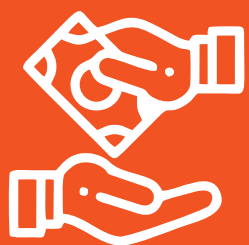
Pagamento da taxa de franquia