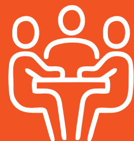
Reunião de Boas Vindas