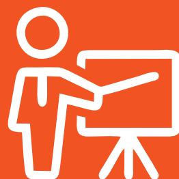
Apresentação da empresa