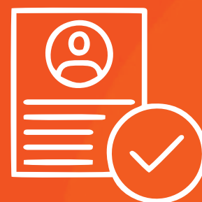
Análise do contrato