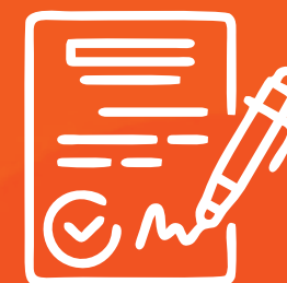
Assinatura do contrato