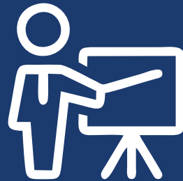
Apresentação da empresa