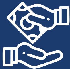
Pagamento da taxa de franquia