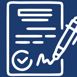
Assinatura do contrato