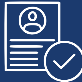
Análise do contrato