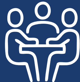
Reunião de Boas Vindas